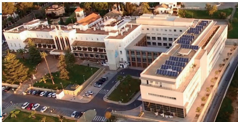
El Hospital San Juan de Dios de Córdoba.