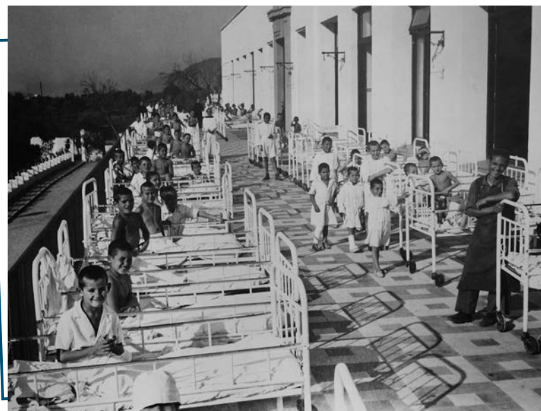
Terraza de la Clínica San Rafael, Córdoba.