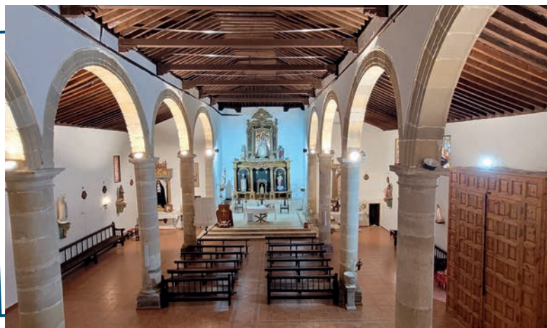
Interior de la iglesia Nuestra Señora de la Paz.