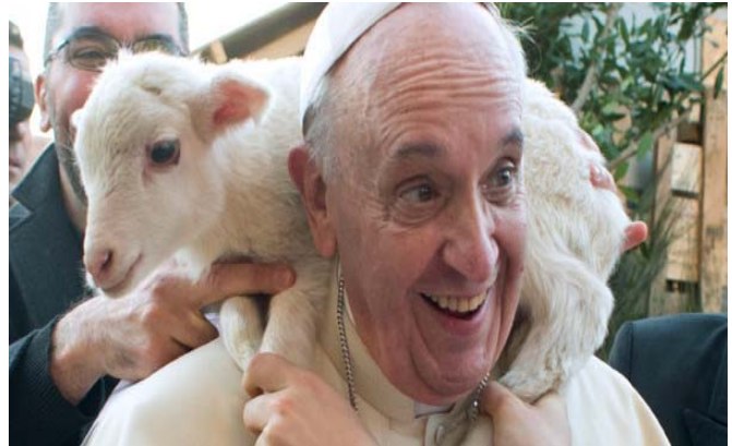
Botschaft von Papst Franziskus zum 55. Weltgebetstag um geistliche Berufungen

Die selige Jungfrau Maria, das junge Mädchen von der Peripherie, das auf das menschengewordene Wort Gottes gehört, es angenommen und gelebt hat, behüte uns und begleite uns allzeit auf unserem Weg.