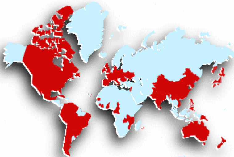
Mapa de la Orden

Las presencias y el tipo de obras son muy diversas. Existen centros altamente tecnificados, centros de salud mental y atención a discapacitados intelectuales y físicos, centros para enfermos crónicos, ancianos y terminales, centros en países empobrecidos, centros para excluidos y para personas que sufren adicciones, estando siempre abierta la Orden a la promoción de obras para la atención de las nuevas necesidades. Para llevarlas adelante la Orden colabora frecuentemente con las administraciones públicas y con otras entidades eclesiales y sociales, con las que coincide en sus finalidades fundamentales. En algunas ocasiones la Orden promueve sus obras en lugares donde los estados y otras instituciones no llegan, para atender a las personas más vulnerables.